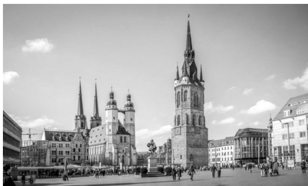
Der Marktplatz in Halle an der Saale

Da Deutschland groß ist und unsere Mitglieder weit verstreut sind, soll jedes Mitglied in regelmäßigen Abständen die Chance auf eine kürzere Anreise haben.