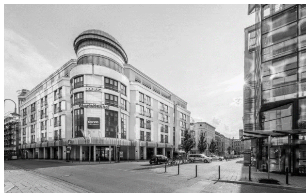
Unser JHV-Hotel ist das Dorint Hotel Halle.